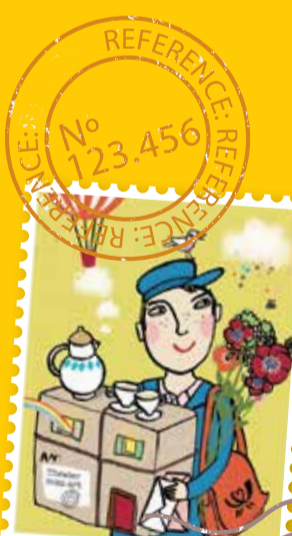
Grafik Silke Schmidt und freepik.com

Fr 01.12. 10.00 Schulpremiere Sa 02.12. 18.00 Premiere I So 03.12. 16.00 Premiere II Mo 04.12. 10.00 Schulvorstellung Di 05.12. 10.00 Schulvorstellung Mi 06.12. 09.00 und 11.00 Schulvorstellungen Do 07.12. 09.00 und 11.00 Schulvorstellungen So 10.12. 16.00 Vorstellung zum 2. Advent Mo 11.12. 10.00 Schulvorstellung Di 12.12. 9.00 und 11.00 Schulvorstellungen Mi 13.12. 9.00 und 11.00 Schulvorstellungen